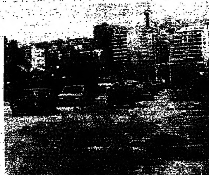
الحركة على طريق القويطة - الجديدة امس (شهادة المصانير)

غير ان البحث في الشأن السياسي لم يتعثر، وان كان هو الآخر بطيء الحركة، لان الموافقة على البند الستة التي تشكل مبدئي الحل السياسي، دونها لم تكن التفاصيل، وان الامتياز يتركز على حلحلة هذه التفاصيل التي تشكل اهمية توازي المبادئ الثماني، كما قالت اوساط مقربة من لجنة الوساطة، التي زار اعضاها الاتي بولس نعمان والحلمي شكر ابو سليمان قمر بعيداً بعد ظهر امس واجتمعا في العماد عون، وانضم اليهما الامين العام لحزب الكتائب المهندس ووجيه ديب، وعضو مجلس قيادة القوات، المحامي جورج عدوان، وفي الساعة مساء وصل رئيس حزب الوفاقين الاحرار المهندس داني شمعون، وعقد الجميع اجتماعاً في حضور الوزيرين اللواء الركن ادغار معلوف، واللواء الركن صامو ابو جوره، وتوقعت مصادر سياسية اعلان المرجعية في خلال الساعات الست والثلاثين المقبلة، واشهرت ان هذا الاعلان يجب ان يقترن بتوافق سياسي تلم انطلاقاً من البند الستة التي تم التوافق عليها سابقاً.